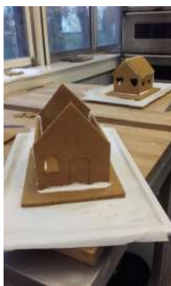
Lassan készülnek a házak.